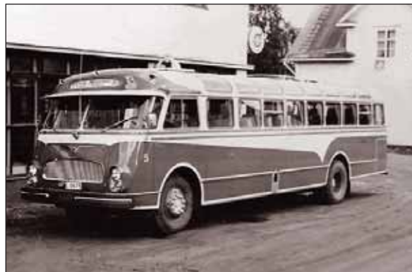
Linja-autoyhteys oli mullistava kehitysaskel ja Kutilan Liikenteen bussi oli komea.

Tarina kertoo paitsi kuvaajansa tarkkanäköisyydestä, myös tarkkailijan elävästä paneutumisesta sekä olojen monimuotoisuudesta ja tietysti muuttumisesta 1900-luvun sotien jälkeiseen aikaan tullessa.