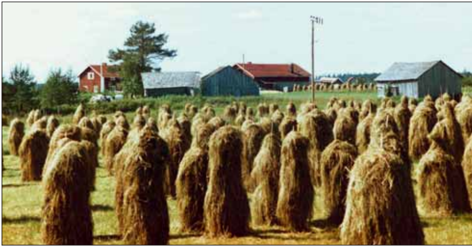
Heinäpelto seipäineen on nykyisin lähes yhtä harvinainen näky ja heinien kuivatusmenetelmä kuin "lapposet" tai "suova".