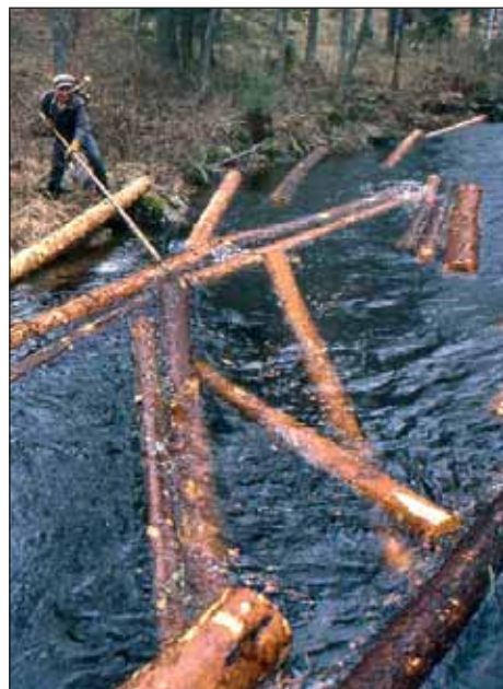
Uittotyöt ovat aina merkittävä tulonlisa vesistön varrella.

Karja kävi metsälaitumilla ja heinä korjattiin luonnonniityiltä. Siihen asti kun Matlaljärvi ja Ryttilampi alkoivat heiniä kasvaamaan, koottiin suuri osa heiniä sydänmaan soista(ita). Olihan se hidasta ja vaikeaa soilta huonosta heinikoista koota. Varsinki kun oli heiniä hajallaan ympäri sydänmaata. Ja talvella kotiin hankkia. Ja niitähan pitää olla melko paljo. Lähes 30 lehmälle usein 5 hevoselle ja lampaille. Vain olihan niitä hevosiakin hakemassa.