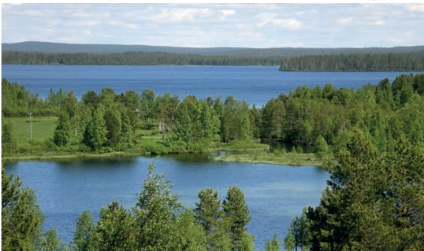
Saunajärven Salamenniska ja Impiönjärvi. Salamenniska / Rytijokisuu oli aikaisin sulava kevätkalastuspaikka. Kuva Timo Impiö 2012.

Yli puolitoista vuosisataa iiläiset ja kemiläiset kilpailivat Simojärven ja sen eteläpäässä olevien järvien kalastusoikeudesta. Lukuisia kertoja erotuomaria haettiin oikeusteitse. Vuosina 1677 ja 1684 oikeus vahvisti oikeaksi kemiläisten suorittamat 42 ja 40 verkon takavarikot, johon heillä oli myös oikeuden lupa.