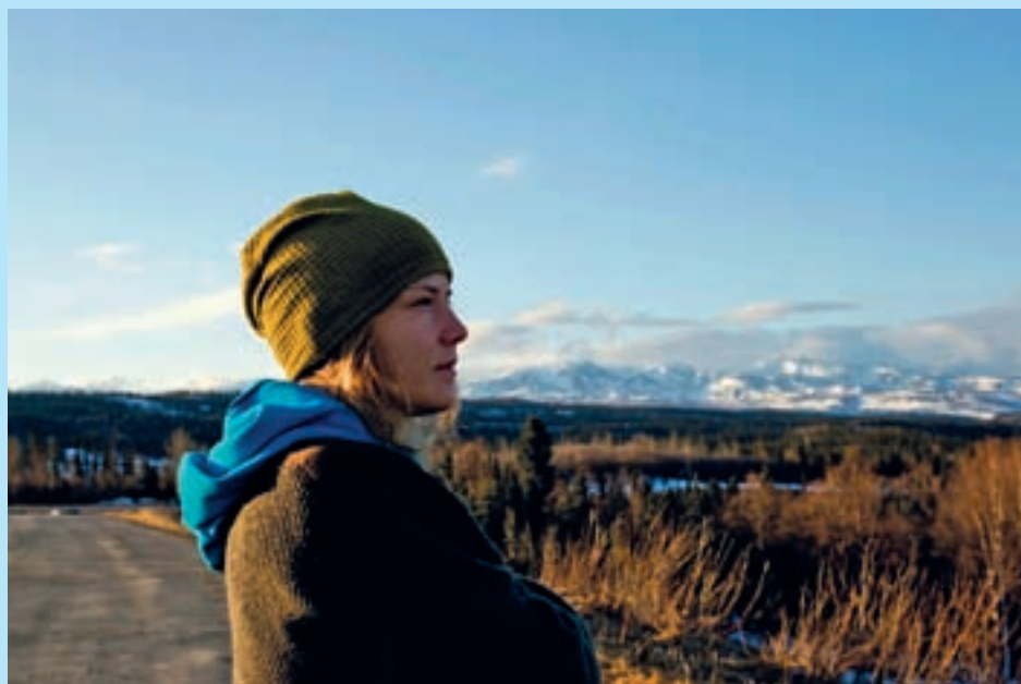
Automatkalla Alaskan Rang vuoristossa.

Lukuissa lienee Impiön sukupuuhunkin kuuluvien joukko, joka elelee eripuolilla maailmaa. Kotipuolellaan Ranualla lomaileva Piia Kortsalo kertoi olemisestaan Alaskassa.