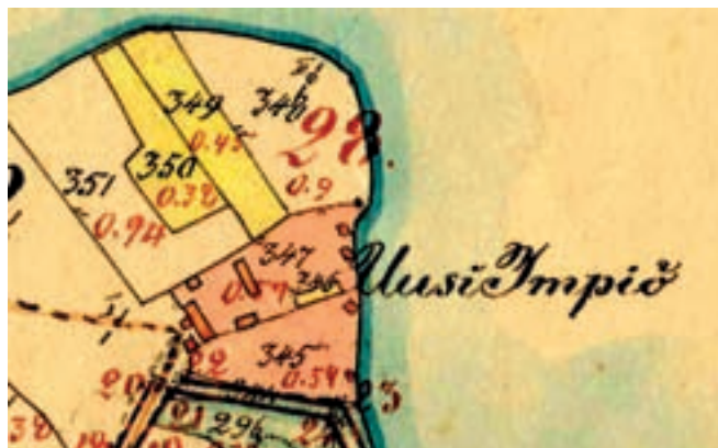
Uusi-Impiön pihapiiri v.1906. Vasemmassa reunassa navetta-/liiterirakennus, vastapäätä pihan takana pitkä kahden uloskäynnin asuinrakennus, välissä kuvan alalaidalla toinen asuinrakennus. Muita maalaistalon rakennuksia kuten, riisiä, latoja, aittoja, sauna, paja. Yhteensä kymmenkunta rakennusta. Halkaisutoimituksen kartta v.1906.